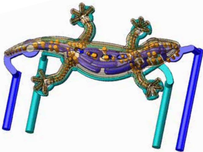
Konturfolgende Temperierung der Auswerferseite. Steuerbar in zwei unterschiedlichen Kreisläufen.

Die Kombination einer variothermen Prozessführung in Verbindung mit einer konturfolgenden Werkzeugtemperierung ergibt folgende Vorteile.